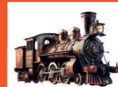
MORD IM ORIENTEXPRESS