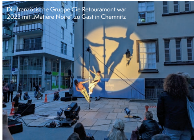
Die französische Gruppe Cie Retourmont war 2023 mit „Matière Noire“ zu Gast in Chemnitz