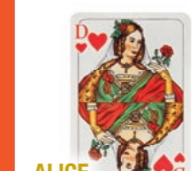
ALICE IM WUNDERLAND