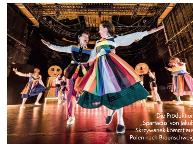
Die Produktion „Spartacus“ von Jakob Skrzywanek kommt aus Polen nach Braunschweig

Die Tradition der Münchner Opernfestspiele reicht bis in das Jahr 1875 zurück, als zum ersten Mal ein „Festlicher Sommer“ veranstaltet wurde. www.staatsoper.de/festspiele