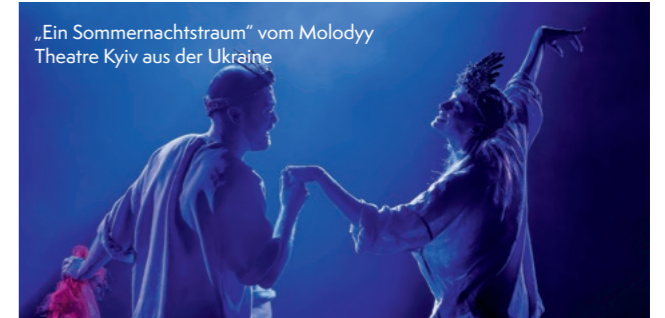
„Ein Sommernachtstraum“ vom Molodyy Theatre Kyiv aus der Ukraine

KunstFestSpiele Herrenhausen 16.5. bis 2.6.2024 Die Kunstfestspiele Herren-