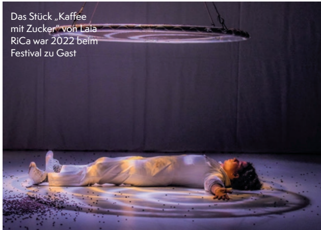
Das Stück „Kaffee mit Zucker“ von Laia RiCa war 2022 beim Festival zu Gast