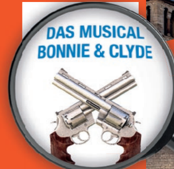
DAS MUSICAL BONNIE & CLYDE