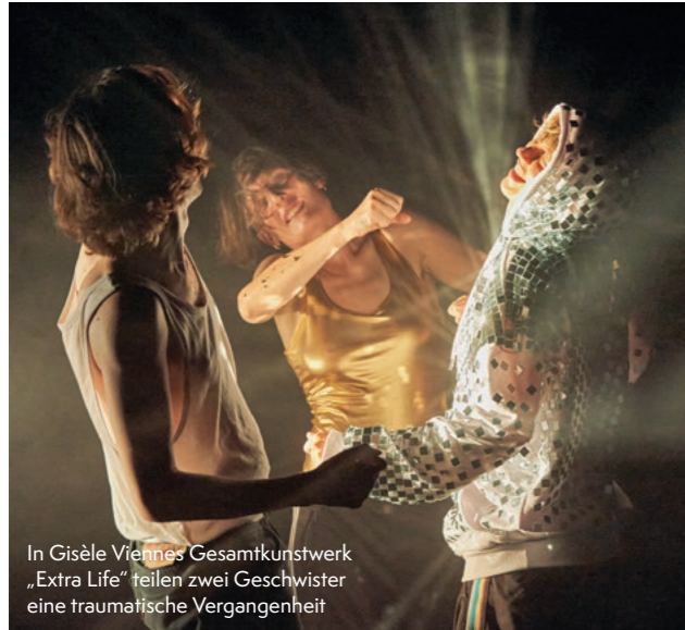
In Gisèle Viennes Gesamtkunstwerk „Extra Life“ teilen zwei Geschwister eine traumatische Vergangenheit