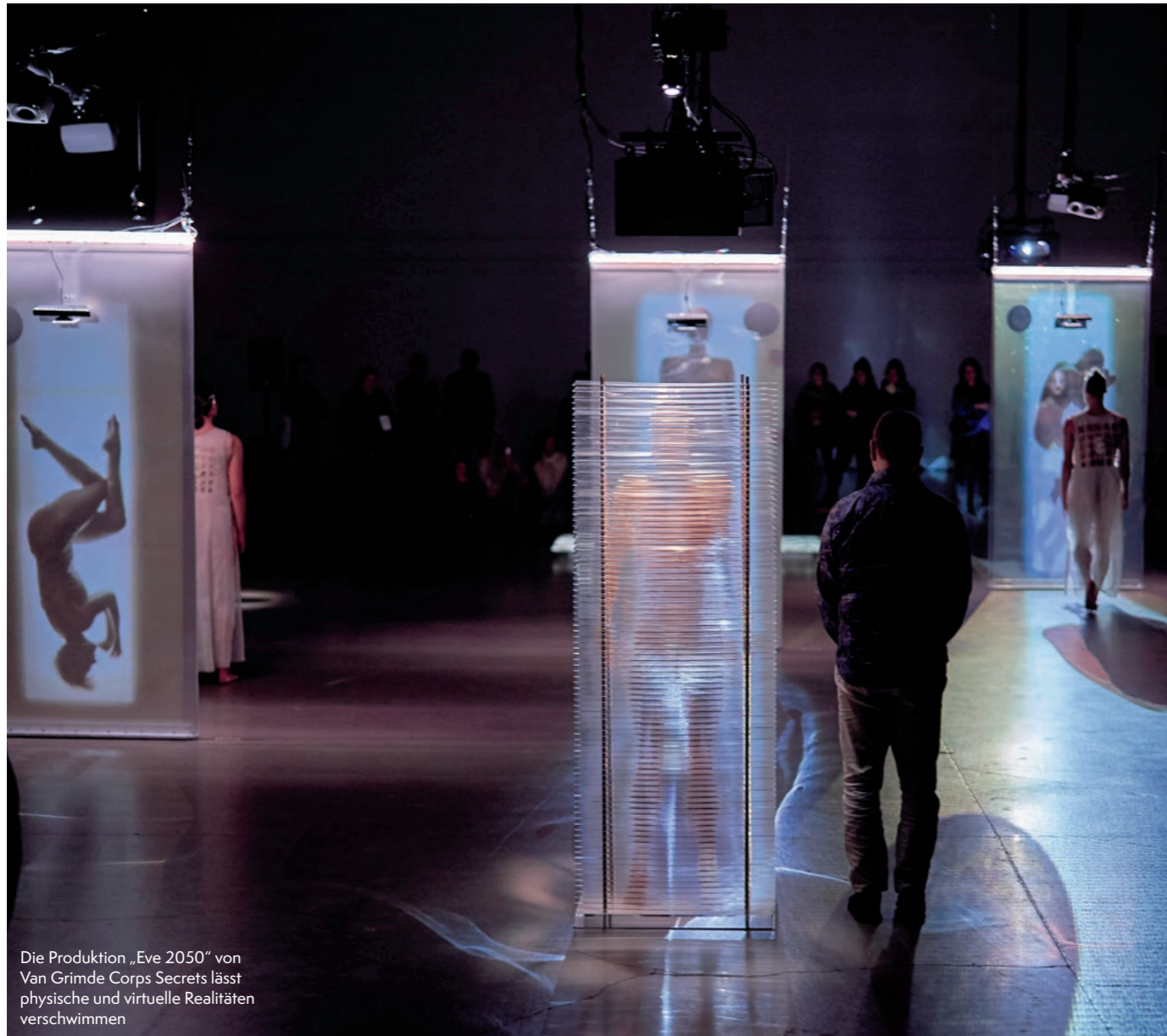
Die Produktion „Eve 2050“ von Van Grimde Corps Secrets lässt physische und virtuelle Realitäten verschwimmen