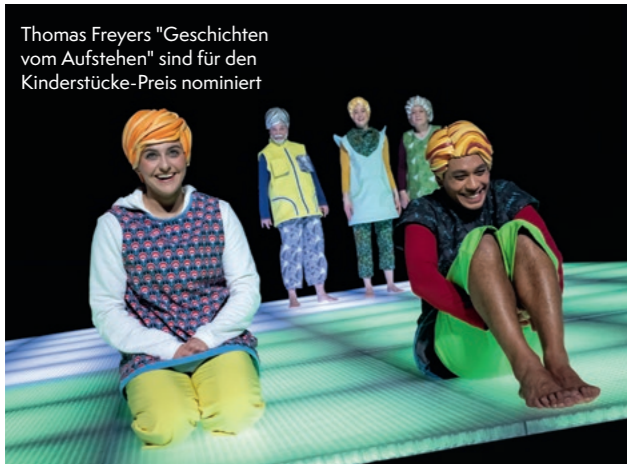
Thomas Freyers "Geschichten vom Aufstehen" sind für den Kinderstücke-Preis nominiert