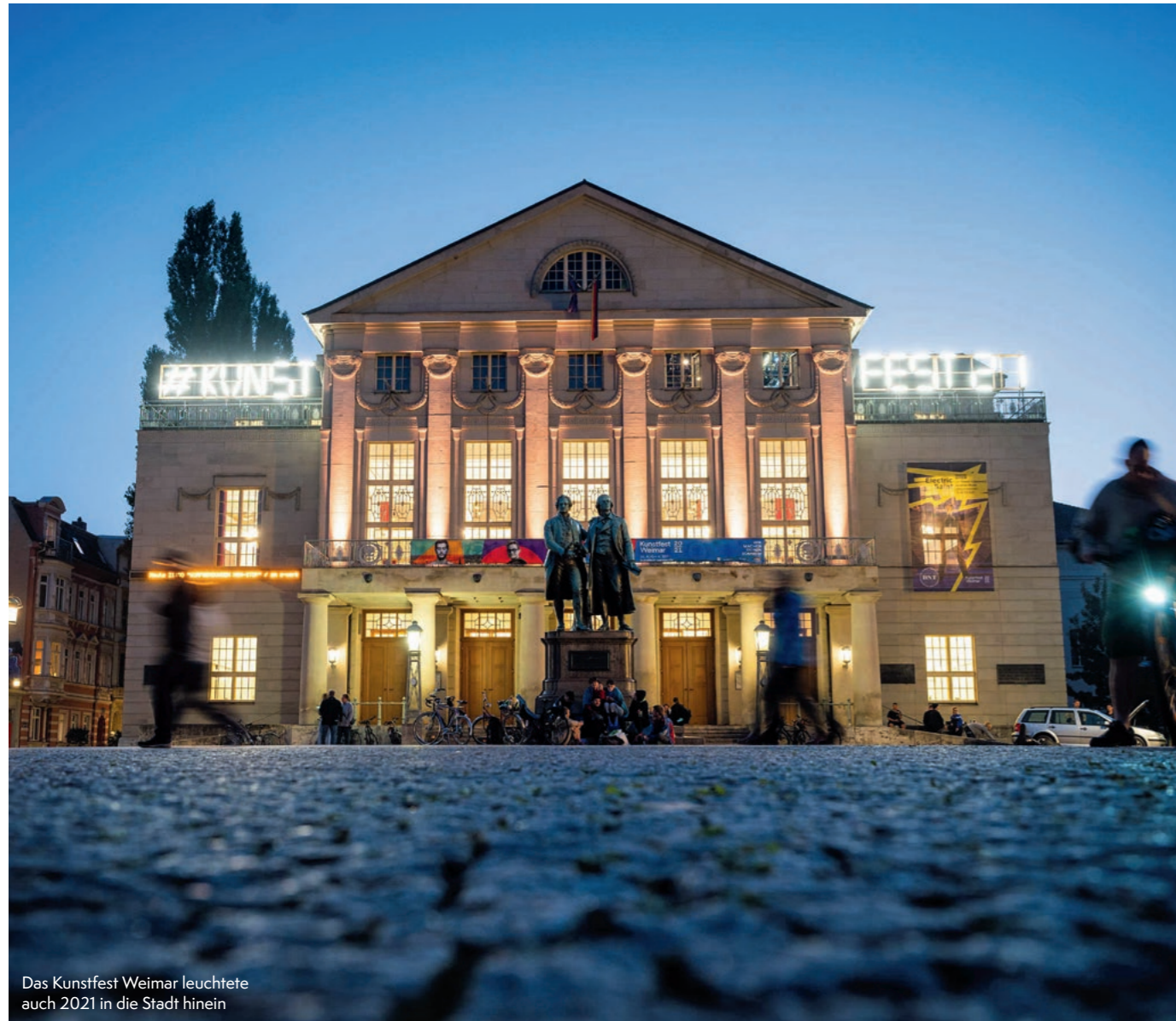
Das Kunstfest Weimar leuchtete auch 2021 in die Stadt hinein