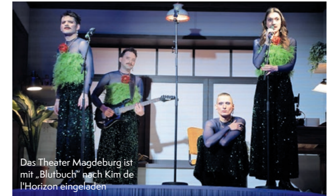
Das Theater Magdeburg ist mit „Blutbuch“ nach Kim de l'Horizon eingeladen

5. bis 15.9.2024 Das Festival Bayreuth Baroque bringt seit 2020 jährlich im September Opernwerke des Barocks