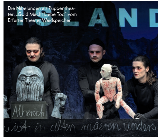
Die Nibelungen als Puppentheater: „Gold Macht Liebe Tod“ vom Erfurter Theater Waidspeicher

Die Raimundspiele Gutenstein sind eine Veranstaltungsreihe in Gutenstein in Niederösterreich, die seit 1993 jährlich während der Sommermonate stattfindet. Bis