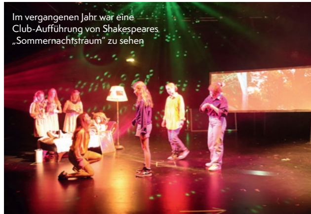
Im vergangenen Jahr war eine Club-Aufführung von Shakespeares „Sommernachtstraum“ zu sehen