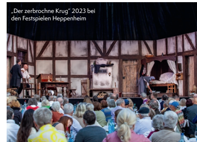
„Der zerbrochne Krug“ 2023 bei den Festspielen Heppenheim

Das Festival ist ein viertägiges Kunst- und Kulturfestival in Dahnsdorf. An fünf unterschied-