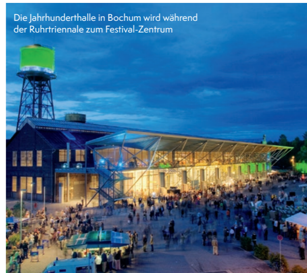
Die Jahrhunderthalle in Bochum wird während der Ruhrtriennale zum Festival-Zentrum

Das größte Kulturfestival in der europäischen Bäderregion bietet über 300 Veranstaltungen in Bad Elster sowie in rund 40 Spielorten der Vierlandregion. www.chursaechsische.de/veranstaltungen/chursaechsischer-sommer