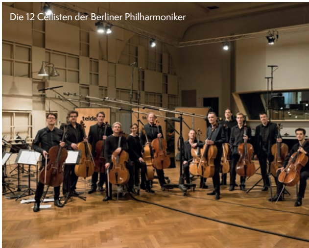
Die 12 Cellisten der Berliner Philharmoniker