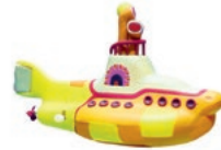
DIE GROSSE BEATLES-SHOW