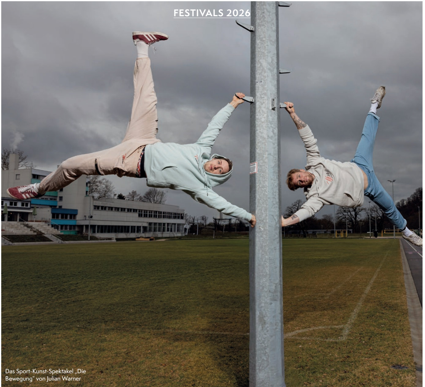
Das Sport-Kunst-Spektakel „Die Bewegung“ von Julian Warner