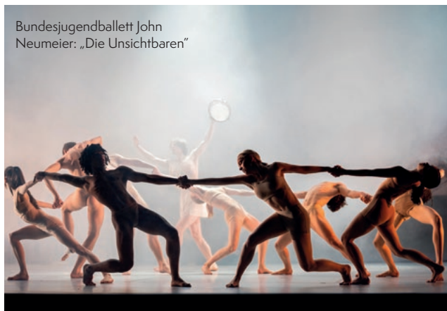
Bundesjugendballett John Neumeier: „Die Unsichtbaren“