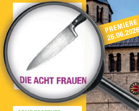
DIE ACHT FRAUEN