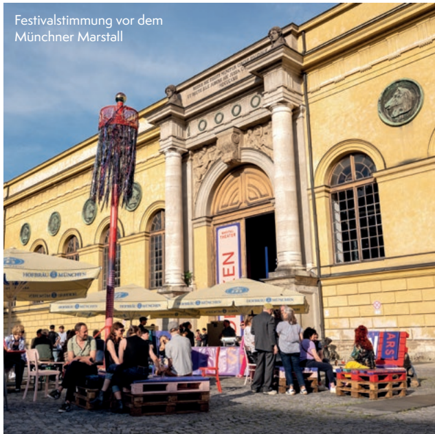
Festivalstimmung vor dem Münchner Marstall