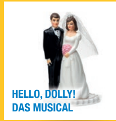
HELLO, DOLLY! DAS MUSICAL