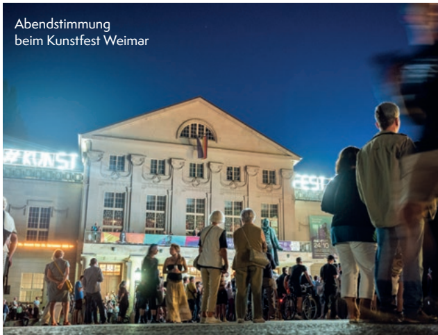
Abendstimmung beim Kunstfest Weimar