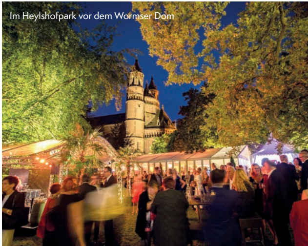
Im Heylshofpark vor dem Wormser Dom

17.7.-2.8.2026 WORMS, NIBELUNGENFESTSPIELE