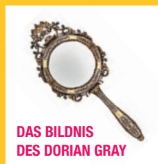
DAS BILDNIS DES DORIAN GRAY