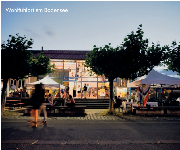
Wohlfühlort am Bodensee