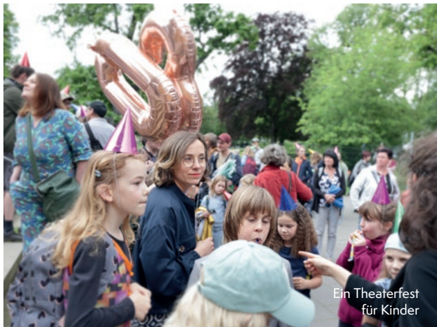
Ein Theaterfest für Kinder

Sich einen Tag lang intensiv mit inklusiver Kunst und Ver-