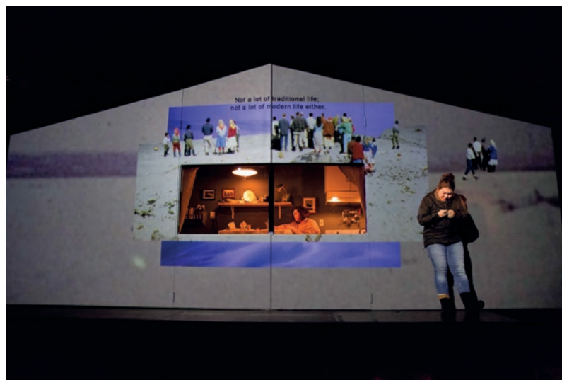
Die Produktion „Aalaapi/ᐱᐱᐱᐱ“ kommt aus dem Norden Kanadas