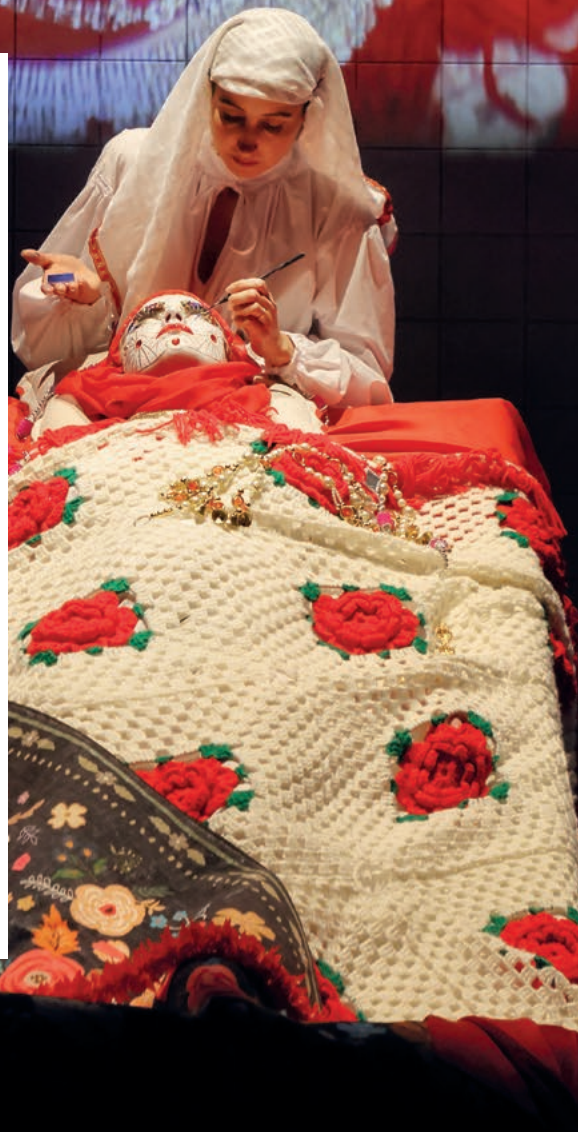
„Balkan Erotic Epic“ von Marina Abramović

Seit 2002 nutzt die Ruhrtriennale die Industrie-architektur des Ruhrgebiets als Kulisse für Musik-theater, Schauspiel, Tanz, Performance, Konzert, Installation und Bildende Kunst. Auch im dritten und letzten Jahr unter der Leitung von Ivo Van Hove setzt das Programm der Ruhrtriennale auf aktuelle gesellschaftliche Themen. Marina Abramović, die wohl berühmteste Performance-Künstlerin der Welt, präsentiert ihre monumentale Inszenierung „Balkan Erotic Epic“, bei der das Publikum sich frei durch 13 Szenen rund um Erotik und Spiritualität der Balkan-Mythologie bewegen kann. Im Festivalzentrum „Wunderland“ neben der Jahrhunderthalle in Bochum gibt es jede Menge Gelegenheiten, sich auszutauschen und gemeinsam zu feiern. Im Rahmen der Konzertreihe „Ruhr Diamonds“ übernehmen an allen Samstagen lokale Musiker:innen die Bühne und spielen Pop-Punk, Rap und Trap bei kostenlosem Eintritt. Außerdem gibt es Mitmachangebote für Kinder, Tanzworkshops für alle sowie Lesungen und Performances von Nachwuchsautor:innen.