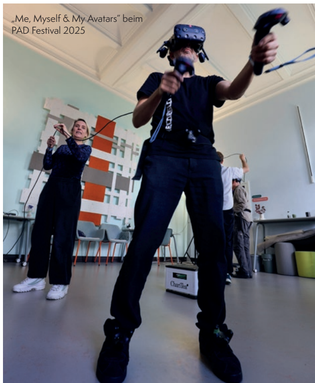
„Me, Myself & My Avatars“ beim PAD Festival 2025

22.10.-25.10.2026 WIESBADEN, PAD FESTIVAL