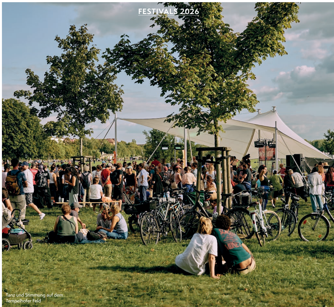
Tanz und Stimmung auf dem Tempelhofer Feld