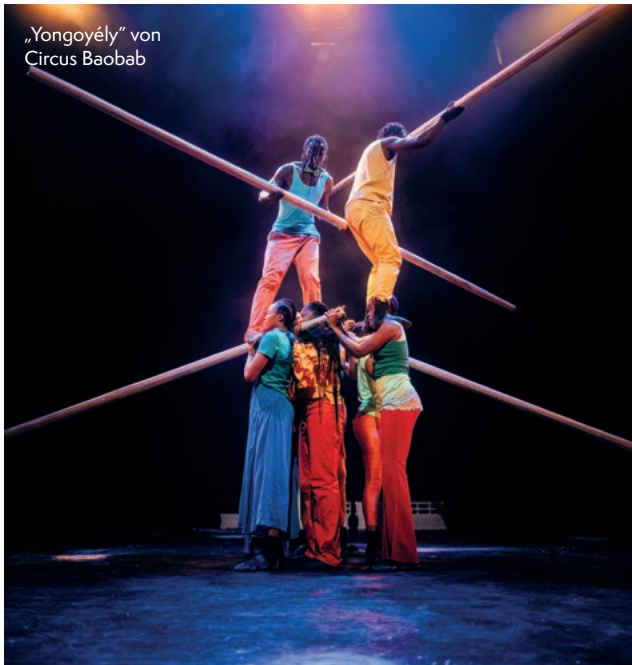
„Yongoyé“ von Circus Baobab

18.6.-28.6.2026 BRAUNSCHWEIG, THEATERFORMEN