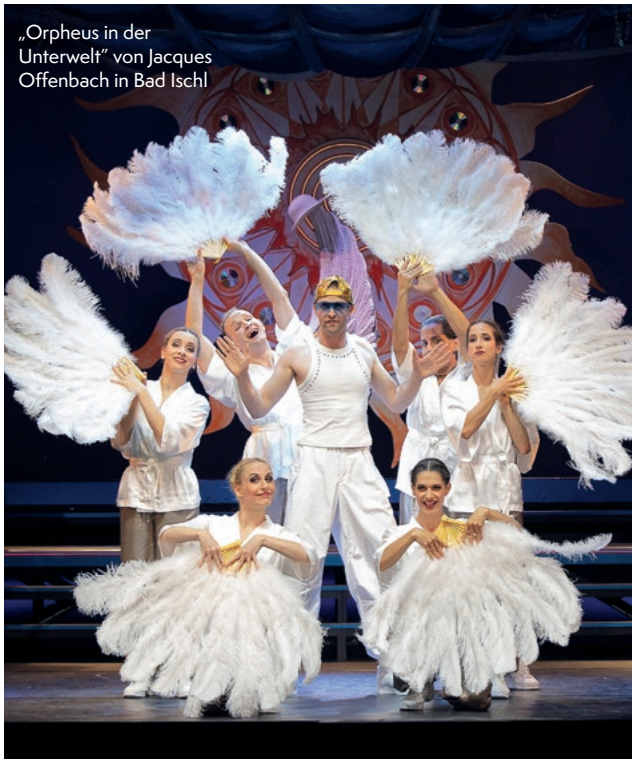
„Orpheus in der Unterwelt“ von Jacques Offenbach in Bad Ischl

11.7.-30.8.2026 BAD ISCHL, LEHÁR FESTIVAL